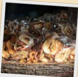
Chips de pommes